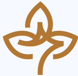
گروه زرین غله ZARRIN GRAIN GROUP