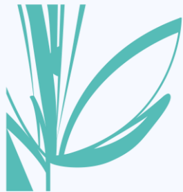
Tose' Ghalat Zarrin Khalij-e Fars